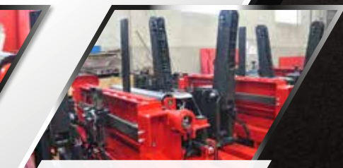
Twin log turners – movable for big logs

* Option / additional equipment (page 14)