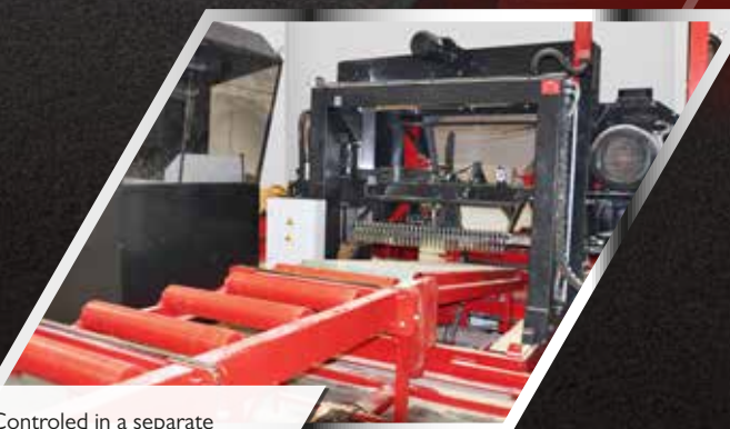
Controlled in a separate operator cabin.