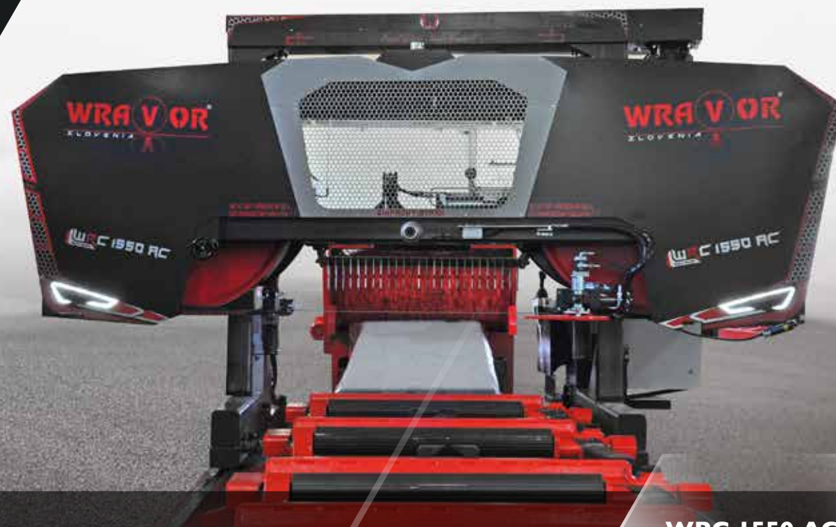
WRC 1550 AC

Specialty of these bandsaws is a robust and wide construction with additional reinforcements. All manipulation and control components including electronics are adapted to harsh weather conditions. We have also perfected form for easy transportation and installation.